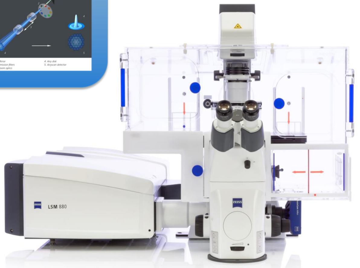
ZEISS LSM 880 with Airy scan